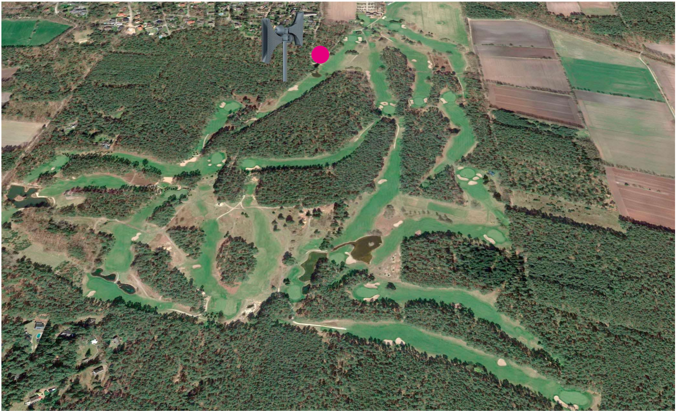
Der Standort des Gewitter-Warnsystems

“Wann wird das Spiel wieder aufgenommen?” Wichtige Information im Falle eines Alarms.